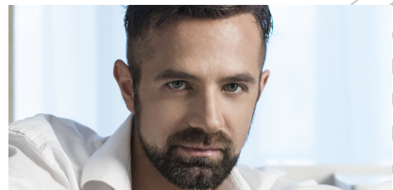
Max Emanuel Cencic ( Arbace )