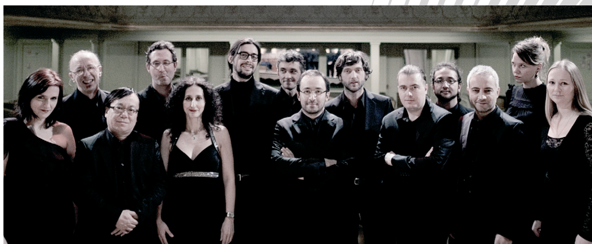
Il Pomo d'Oro (Orchestre)