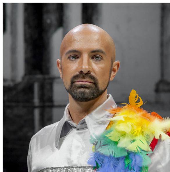
Max Emanuel Cencic

Exclusivement masculine conformément à un décret papal, la distribution d' Il Catone in Utica était menée à la création par le célèbre castrat Carestini dans le rôle de Cesare.