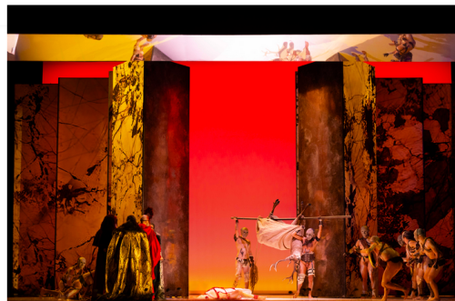
Los restos del ciervo sagrado de Diana en 'Ifigenia in Aulide'