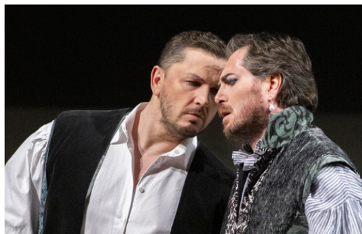
Orlando Furioso