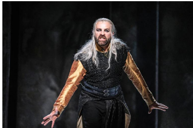
Festival-Chef Max Emanuel Cencic als Agamemnone.

Zum fünften Mal lockt das Festival „Bayreuth Baroque“ in die Wagnerstadt. Wieder gibt es eine Ausgrabung, Porporas „Ifigenia in Aulide“. Die Premiere wird zum Stimmenfest im antikisierenden Ambiente.