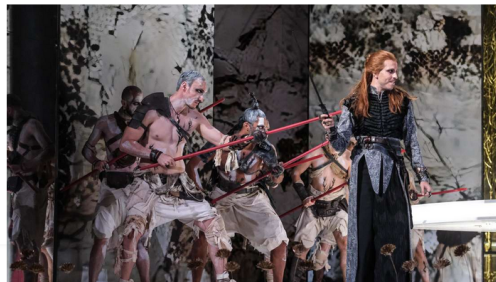
Mayaan Licht como Achille en 'Ifigenia in Aulide'