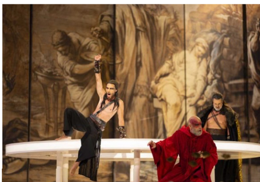
Ifigenia in Aulide