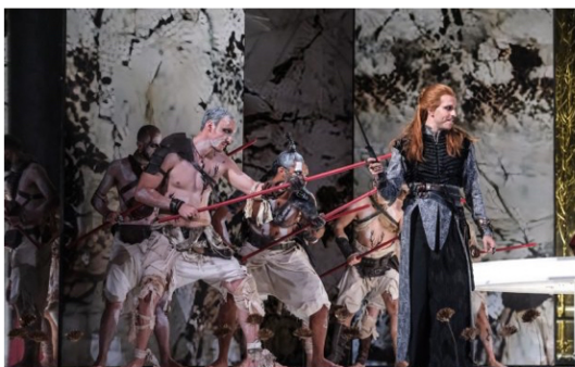
Ifigenia in Aulide

Les Talens Lyriques de Christophe Rousset, en résidence cette saison au festival, ont eu la charge d'exhumer, avec la précision et la ferveur qu'on leur connaît, cette partition de haut vol. Excellence du contrepoint dès l'ouverture, duos musclés, trios enflammés, et surtout festival de pyrotechnie. Porpora ayant eu bourse ouverte auprès de la Nobility, il put engager, afin de rivaliser avec Carestini et Anna Maria Strada del Pò affichés au même moment par Haendel dans Ariodante , le Farinelli (Achille), le Senesino (Agamemnonne), la Cuzzoni (Ifigenia) et le Montagnana (Calcante). C'est dire la difficulté technique de la partition pour les chanteurs actuels.