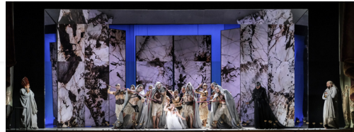
Clitennestra, Ifigenia en peligro y su doble, y Agamennone

Desde la fundación de Les Talens Lyriques en 1991, Christophe Rousset y su orquesta trabajan para redescubrir el patrimonio musical europeo. Han contribuido a dar a conocer las composiciones napolitanas y, en particular, la obra de Nicolò Porpora , cuyo redescubrimiento le debemos en gran medida. Recordarán que, cuando crearon la banda sonora de la película Farinelli , propusieron un aria del Pollifemo de Porpora, «Alto Giove». Este año, Christophe Rousset y Les Talens Lyriques han sido invitados a ser la Orquesta en Residencia del Festival Barroco de Bayreuth , una elección de lo más afortunada. En Ifigenia , la orquesta y su director aportan su experiencia para expresar el lirismo de la obra y, siempre atentos a los cantantes, acompañan y apoyan las líneas y el virtuosismo del canto. Su trabajo, tan apasionado como preciso, fue aplaudido con entusiasmo por el público.