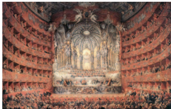
Teatro Argentina à Rome