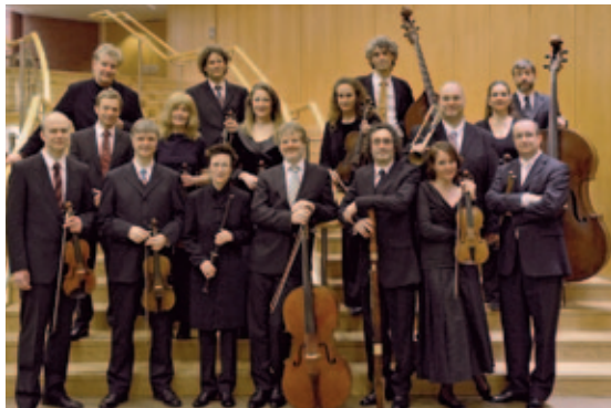
Concerto Köln (orchestre)