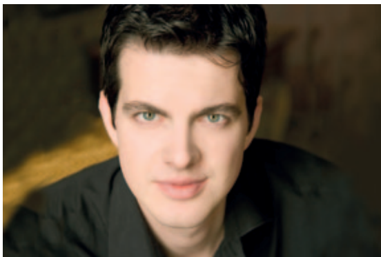
Philippe JAROUSSKY (Artaserse)