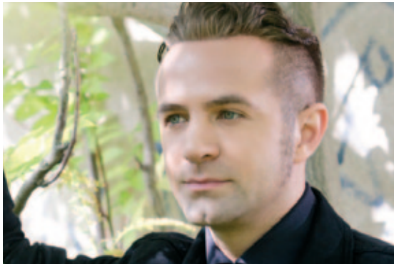
Max Emanuel CENCIC (Mandane)