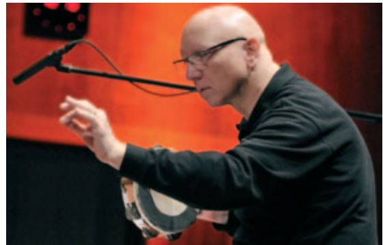
Diego Fasolis (conducteur)